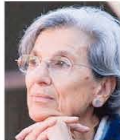
CHIARA SARACENO LA SOCIOLOGA TORNERÀ AL FESTIVAL CON UNA LEZIONE SUL GENDER GAP

È sempre stata tra i welfare locali più avanzati nel nostro Paese